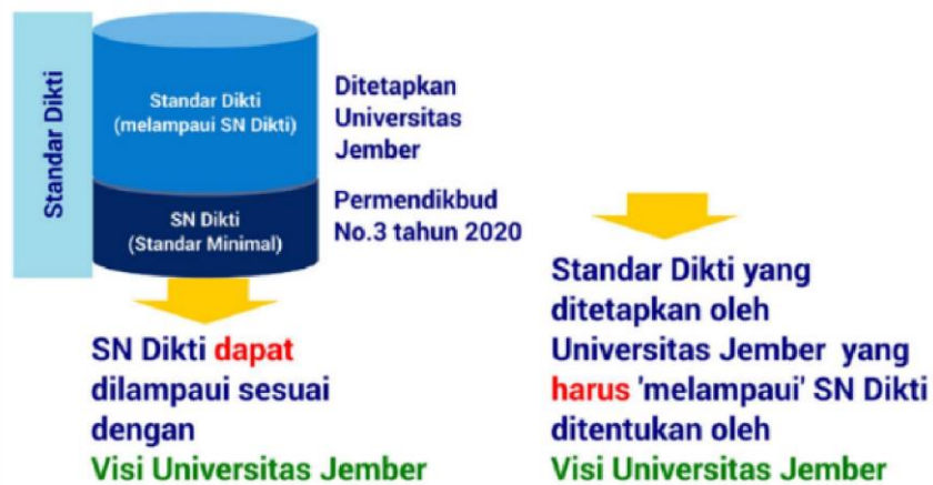
Gambar 2. Pelampauan Standar UNEJ terhadap SNDikti