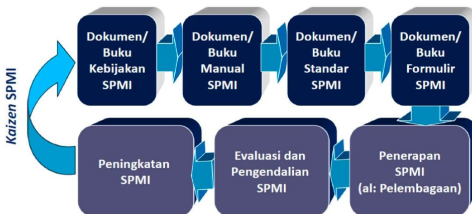
Gambar 4. Siklus tahapan membangun pelaksanaan SPMI dengan prinsip PPEPP.

internal ini dilakukan sehingga jika sistem berjalan dengan baik, peningkatan mutu UNEJ akan terjadi secara berkelanjutan/Kaizen SPMI (Gambar 4).