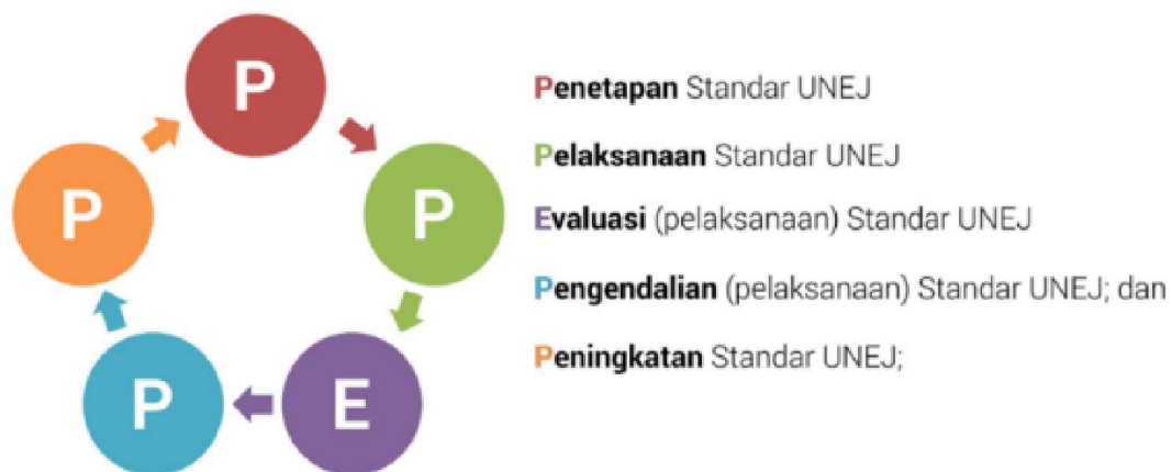
Gambar 1. Sistem Manajemen Mutu Internal

Berdasarkan Pasal 52 ayat(2) UUNo.12 Tahun 2012 tentang Pendidikan Tinggi, penjaminan mutu dilakukan melalui Penetapan Standar Dikti; Pelaksanaan Standar Dikti; Evaluasi dari pelaksanaan Standar Dikti; Pengendalian (pelaksanaan) Standar Dikti; dan Peningkatan Standar Pendidikan Tinggi yang di singkat dengan PPEPP. Oleh karena itu, Pascasarjana harus menetapkan standar yang ingin di capai melalui proses pelaksanaan mencapai standar dengan siklus PPEPP tersebut (Gambar 1)