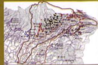
Peta Aset Irigasi Kares, Besuki