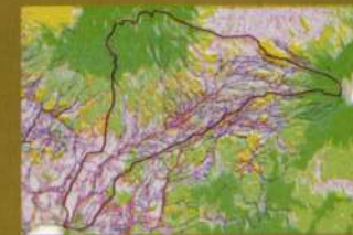
Peta Sungai Kares, Besuki